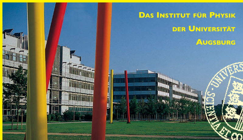
DAS INSTITUT FÜR PHYSIK DER UNIVERSITÄT AUGSBURG