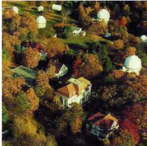
Die Sternwarte der Universität Hamburg

Heute sind die WissenschaftlerInnen der Hamburger Sternwarte eng in internationale Kooperationen eingebunden. Die Hamburger Sternwarte beherbergt zwar das drittgrößte optische Teleskop in Deutschland, dennoch kommen die Teleskope vor Ort nur noch teilweise zu Forschungszwecken zum Einsatz. Mittlerweile werden vor allem internationale Großteleskope und Satelliten genutzt. Zudem betreibt die Hamburger Sternwarte außerhalb ihres Standortes eigene Teleskope wie das robotische Teleskop TIGRE in Guanajuato/Mexiko. 2015 wurde in Norderstedt die dortige Station des europaweiten Radioteleskops LOFAR (Low Frequency Array) eingeweiht, die die Hamburger Sternwarte in Zusammenarbeit mit der Universität Bielefeld betreibt. 1968 wurde die Hamburger Sternwarte als Institut in den Fachbereich Physik der Universität Hamburg integriert und ist seitdem gleichermaßen der akademischen Lehre als auch der astronomischen Forschung verpflichtet. Die Hamburger Sternwarte betreibt astronomische und astrophysikalische Grundlagenforschung. Forschungsschwerpunkte sind: Sternaktivität, Exoplaneten, Sternentstehung und interstellares Medium, intergalaktisches Medium, Galaxienhaufen, Radioastronomie, Atmosphärenmodellierung und Strahlungstransport. In den Forschungsgruppen arbeiten ständig ca. 40 Bachelor- und Master-StudentInnen sowie DoktorandInnen, insgesamt sind knapp 90 Personen im Institut beschäftigt.